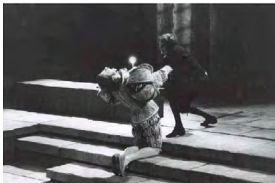
Captation le 16 septembre 1977 à la Comédie Française (2 parties avec entracte).

Le cinéma Le Méliès propose la projection de la captation de la mise en scène de LORENZACCIO par Franco Zeffirelli à la Comédie Française en septembre 1977, et la première partie d'un cycle consacré à Eric Rohmer dont le cinéma se rapproche souvent de l'oeuvre de Musset.