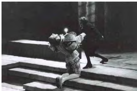
Captation le 16 septembre 1977 à la Comédie Française (2 parties avec entracte).

Le cinéma Le Méliès propose la projection de la captation de la mise en scène de LORENZACCIO par Franco Zeffirelli à la Comédie Française en septembre 1977, et la première partie d'un cycle consacré à Eric Rohmer dont le cinéma se rapproche souvent de l'oeuvre de Musset.